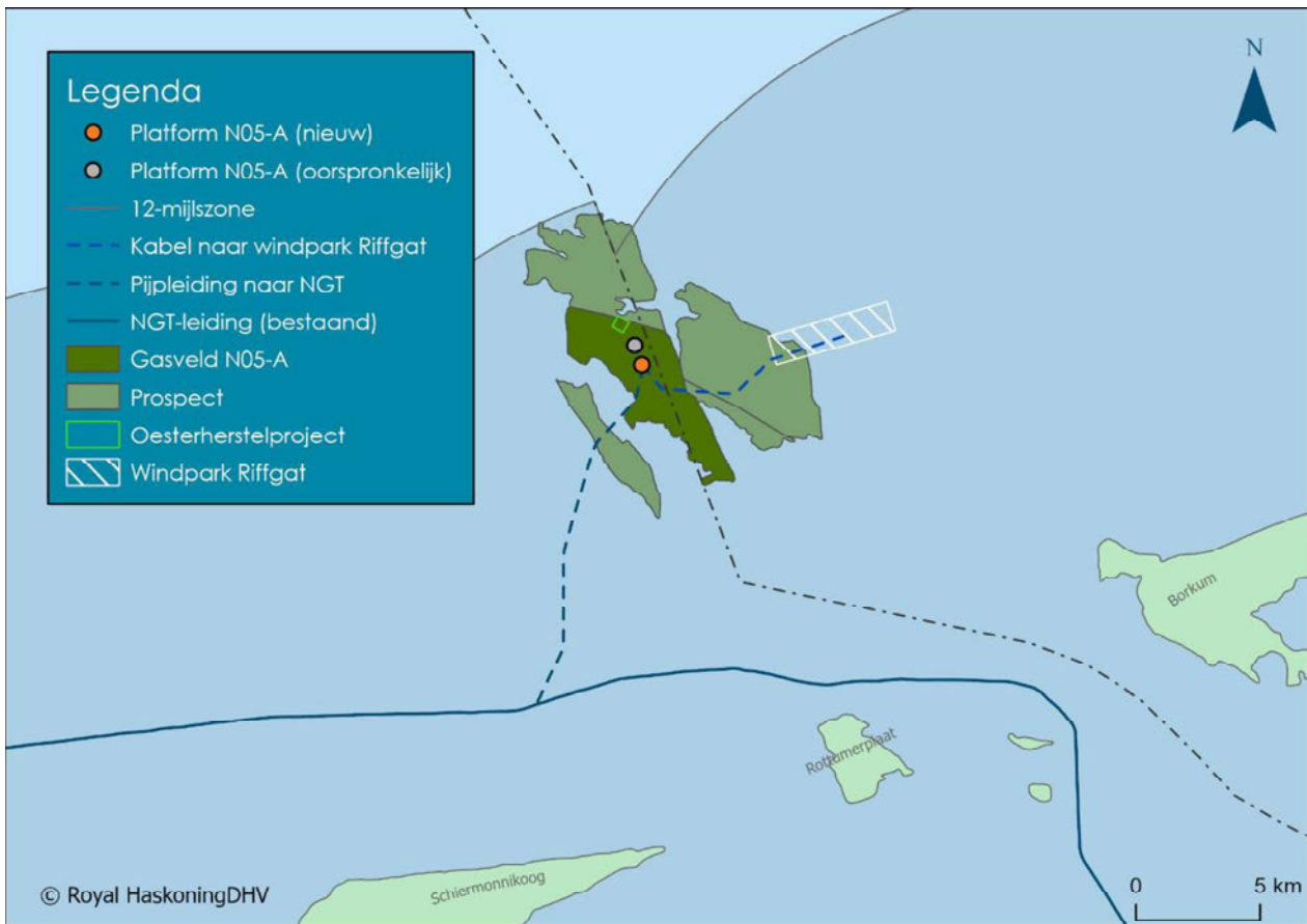
Figuur 1-1: Oorspronkelijke en nieuwe locatie van het productieplatform, inclusief de ligging van de gasvelden en de nieuwe tracés van de gasleiding en de kabel naar windpark Riffgat.