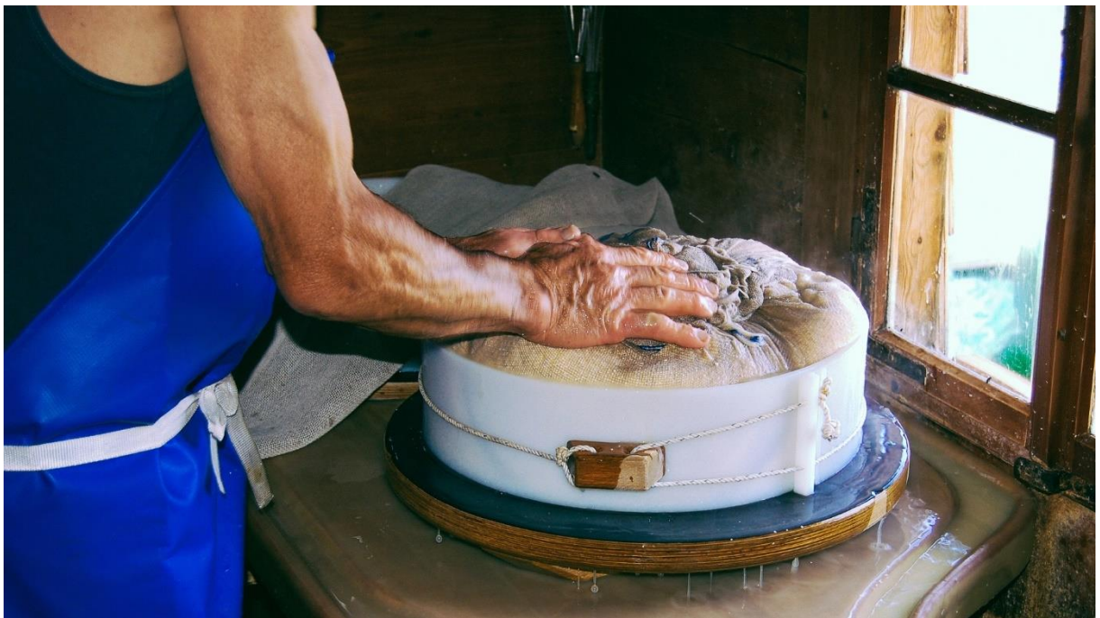
© by scoob via Pixabay – Kaas maken, Zwitserland

Dit overzicht is gemaakt in opdracht van het Ministerie van Buitenlandse Zaken.