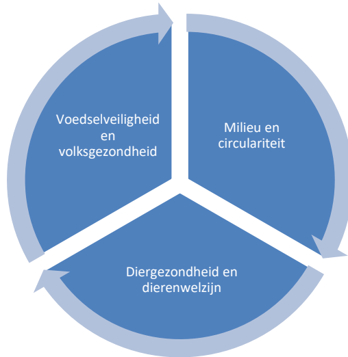
Figuur 1 Onderzoeksonderwerpen binnen de Onderzoeks- en innovatieagenda Nederlandse pluimveesector van AVINED

De voor alle pluimveehouders relevante basisrandvoorwaarden zijn vertaald in onderstaande onderzoeksonderwerpen (zie Figuur 1).