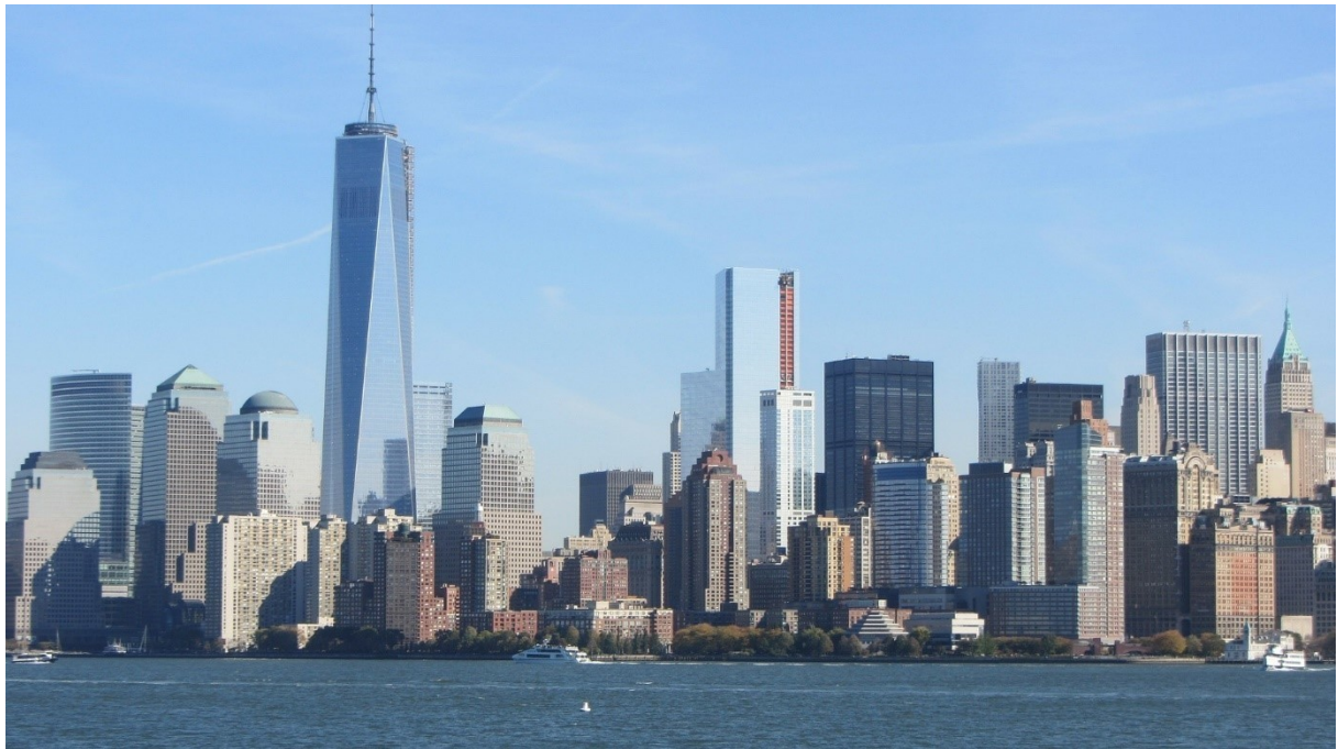
Manhattan, New York, Verenigde Staten

Dit overzicht is gemaakt in opdracht van het Ministerie van Buitenlandse Zaken.