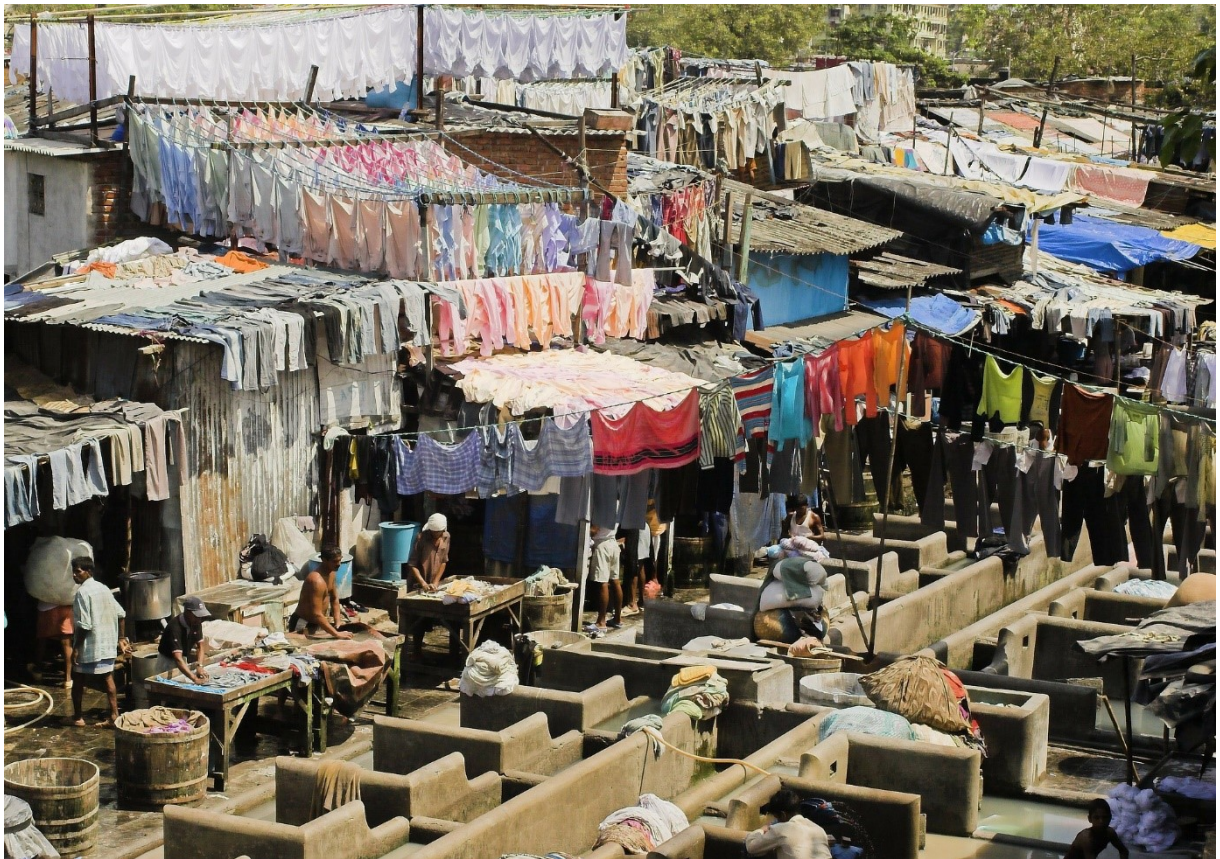
Wasserij Bombay, India

Dit overzicht is gemaakt in opdracht van het Ministerie van Buitenlandse Zaken.