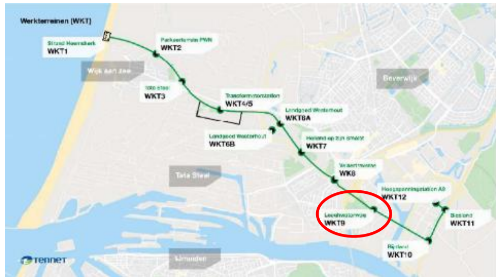
Figuur 1.1: Overzicht werkterreinen met betreffende werkterrein (WKT 9) rood omcirkeld

Ter hoogte van werkterrein 9 wordt het inpassingsplan aangepast door het verleggen van de plangrens en een aanpassing van de aanduiding van ter hoogte van het in- en uittredepunt van de boring. Tevens wordt ter hoogte van de weg aan de noordoostzijde een deel van de dubbelbestemming Leiding – Hoogspanning uit het inpassingsplan net op zee Hollandse Kust (noord) en Hollandse Kust (west Alpha) wegbestemd omdat het kabeltracé meer zuidelijk gelegd wordt (zie figuur 1.2).