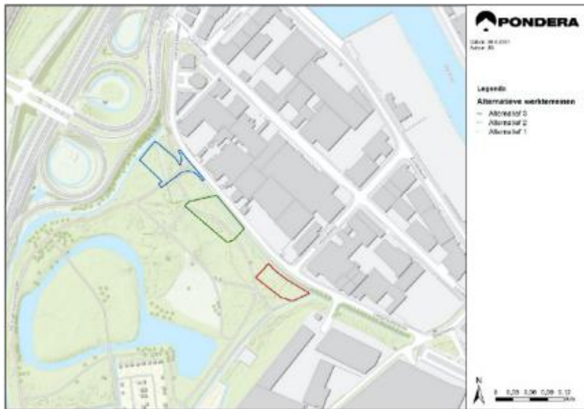
Figuur 1.3: Alternatieven

De conclusie is dat alternatief 1 technisch niet goed uitvoerbaar is, alternatieven 2 en 3 zijn dat wel. Voor alle alternatieven zullen er meer bomen moeten worden gekapt vergeleken met het huidige werkterrein. Alternatief 1 scoort negatief op bekende archeologische waarden, omdat deze locatie zich bevindt in een zone waar onder andere verdedigingswerken uit de 2e Wereldoorlog aangetroffen kunnen worden. Alternatief 1 en 2 scoren negatief op de leefomgeving en ruimtelijke functies, voornamelijk vanwege de nabijheid van gevoelige objecten (woning en een gezondheidsinstelling). Concluderend komt alternatief 3 naar voren als voorkeursoptie, omdat deze technisch uitvoerbaar is en de minste impact op milieu en de omgeving met zich meedraagt.