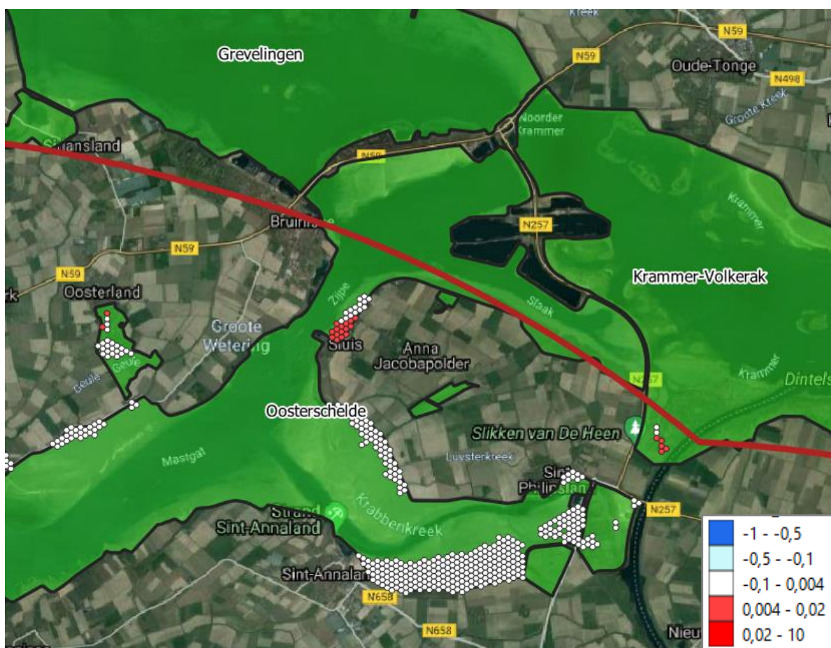
Figuur 2: Verschil in stikstofdepositie tussen de uitgangssituatie en de geplande situatie. (in mol-N/ha.jaar)

Hieruit kan dan ook geconcludeerd worden dat er in realiteit geen toenames in de stikstofdepositie veroorzaakt zullen worden op (naderend) overbelaste polygoon door de nieuwe stortstrategie.