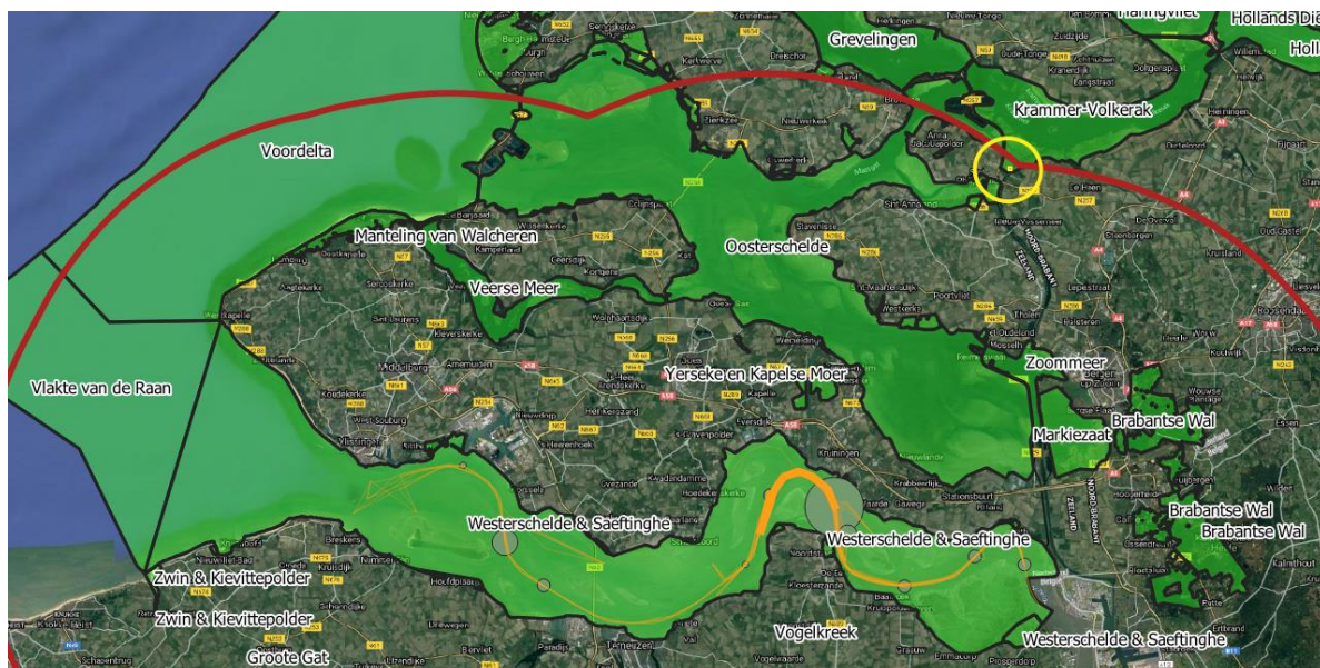
Figuur 1: 25-km-buffer (donkerrood) omheen de emissiebronnen (gele lijnen en groene bollen), met aanduiding van de Natura2000-gebieden (groen) en de ligging van de polygoon in Krammer-Volkerak met een gemodelleerde toename van de stikstofdepositie (middelpunt van de gele cirkel).