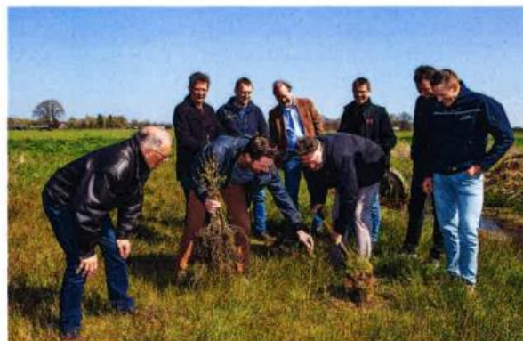
CDEB, Waterschap Brabantse Delta, ZLTO en Probos waren aanwezig bij de aanplant van de eerste elzen.

'De vraag naar biomassa stijgt', licht voorzitter Rudi Antens van CDEB toe. 'Met de aanleg van korte omloopbossen waarin biomassa wordt geteeld met soorten zoals de wilg en els, willen we zorgen dat er lokaal meer biomassa beschikbaar