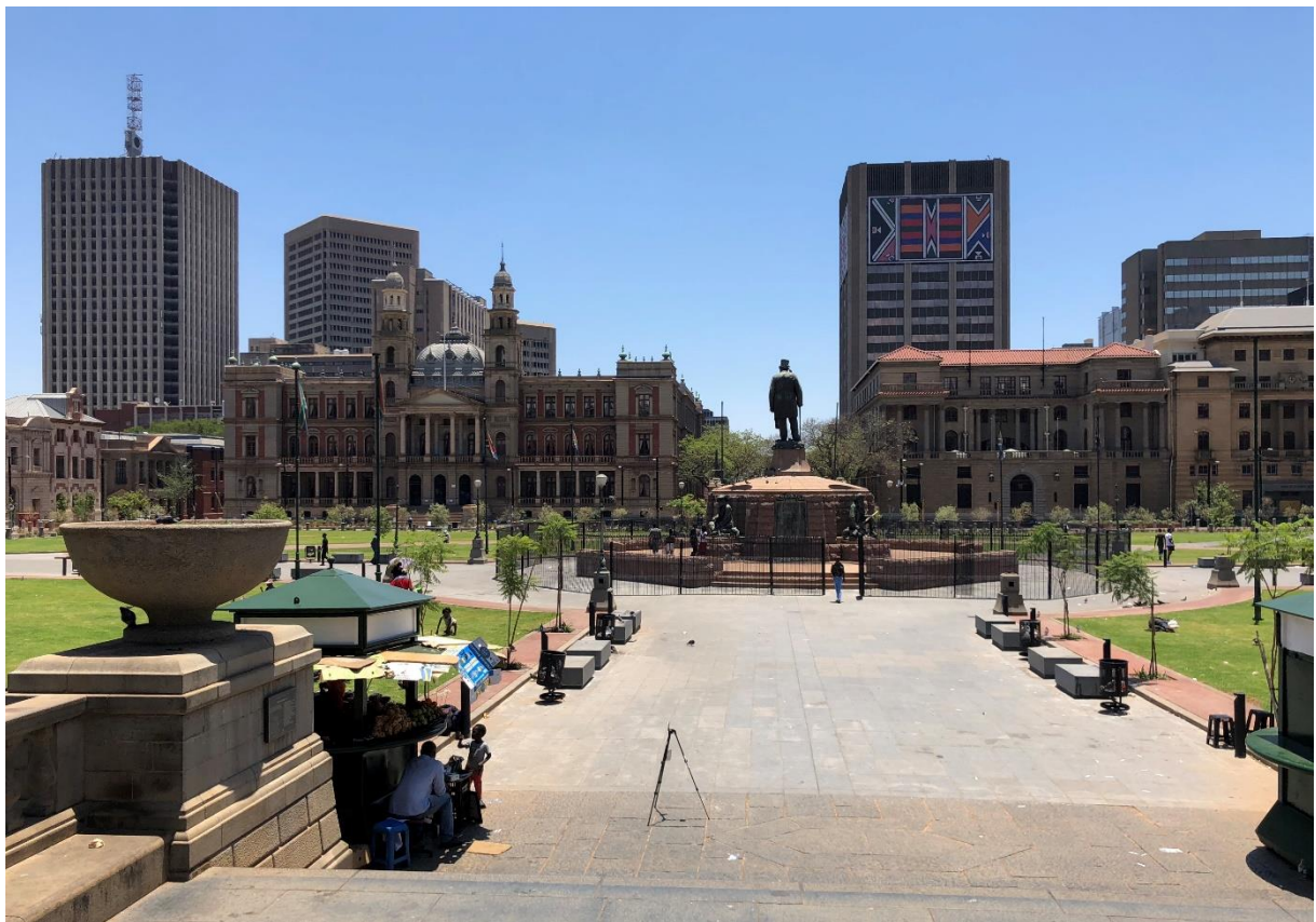
Pretoria, Zuid-Afrika

Dit overzicht is gemaakt in opdracht van het Ministerie van Buitenlandse Zaken.