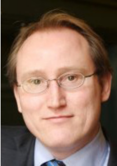
Pieter Waasdorp (voorzitter) Ministerie van Economische Zaken DG ondernemerschap en innovatie