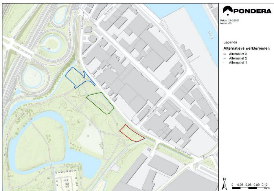
Figuur 1.3: Alternatieven

Vervolgens zijn drie alternatieven verder uitgewerkt (zie figuur 1.3). Hiervan is de technische uitwerking in beeld gebracht.