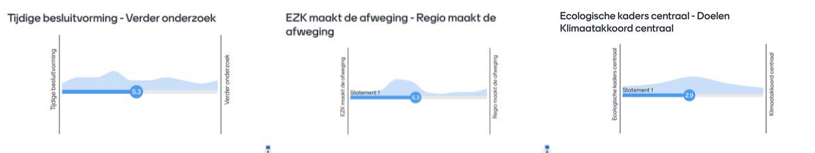
Figuren 1-3: uitslagen stemmingen dilemma's

Uit de peiling wordt duidelijk hoe de deelnemers in deze dilemma's zitten: alle dilemma's scoren in het midden. De gespreksleider nodigt drie deelnemers uit te reageren. Een vertegenwoordiger van de provincie Groningen vindt het goede presentaties en vraagt om aandacht voor samenwerking tussen overheden. Hij is trots op de huidige samenwerking tussen alle overheden in het gaswinningsdossier en hoe de enorme omslag heeft plaatsgevonden, omdat de samenwerking is versterkt. Het tweede punt dat hij meeneemt is het grote belang. Wanneer partijen het grotere belang benadrukken, ziet hij meer kansen. De opgave is complex, er spelen veel belangen. Als iedereen zijn rol pakt, ziet hij mogelijkheden. Dat betekent ook dat overheden hun rol moeten pakken. Ook de provincie wil de planning graag halen. Hij benadrukt dat samenwerking essentieel is.