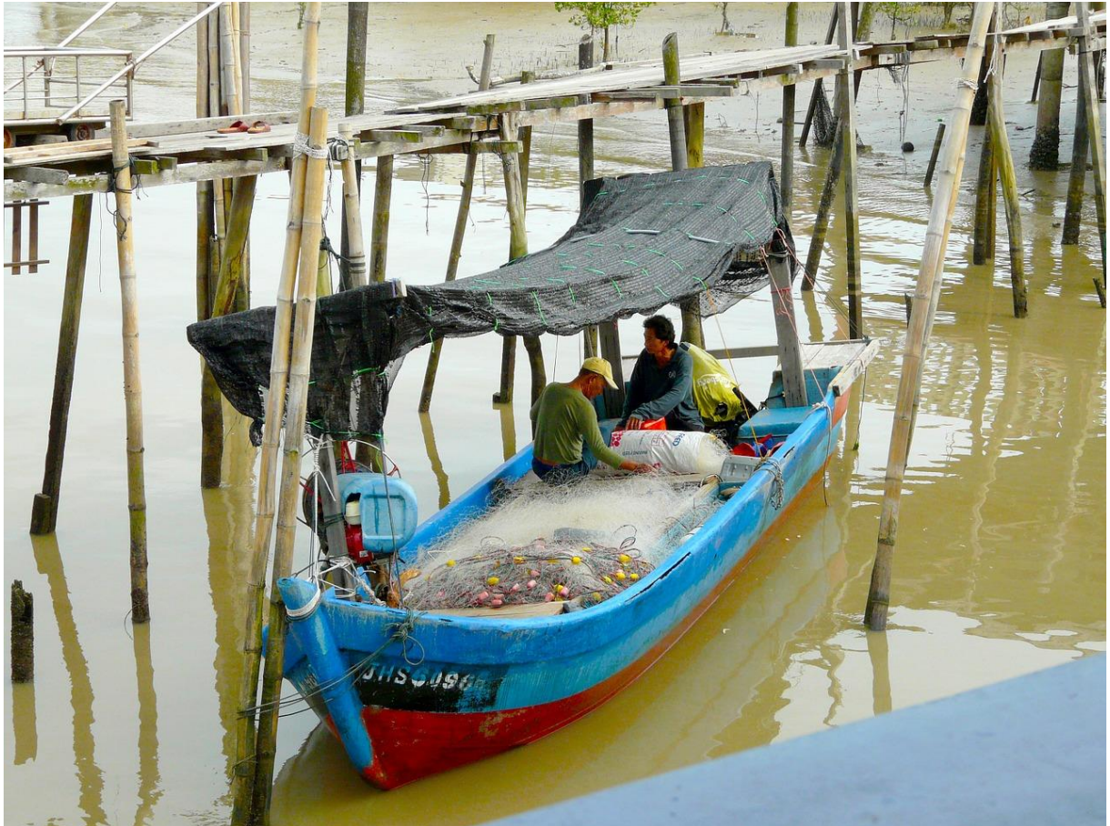
Vissersboot, Maleisië

Dit overzicht is gemaakt in opdracht van het Ministerie van Buitenlandse Zaken.