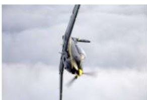
→ Pilatus PC-7 Turbo Trainer