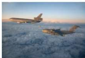
→ McDonnell Douglas KDC-10-transportvliegtuig