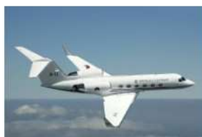
→ Gulfstream IV