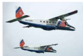
→ Dornier 228-212 Kustwacht