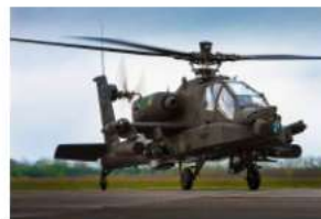
→ Apache AH-64D-gevechtshelikopter