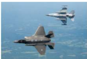
→ F-35 Lightning II-jachtvliegtuig

Fase 2: overige militaire vliegactiviteiten