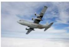
→ C-130 Hercules-transportvliegtuig