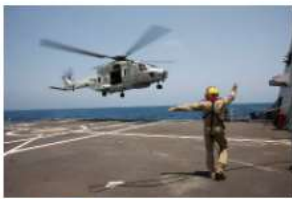
→ NH90-maritieme gevechtshelikopter