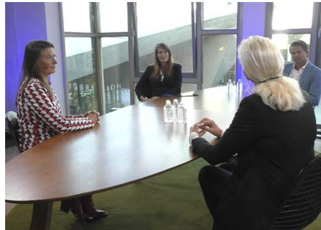
Achter de schermen bij de Talkshow Beyond Borders

Bekijk hier de volledige talkshow Beyond Borders (Engelstalig).