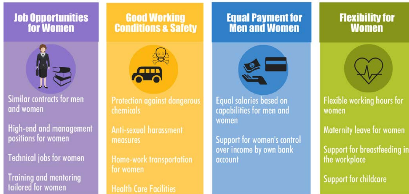
Figuur 1. Aandachtsgebieden voor gender-gerelateerde interventies