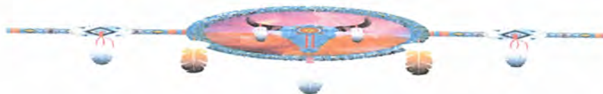
Seattle, voormalig opperhoofd van een zestal indianenstammen uit Noord-Amerika (Uit zijn toespraak, gehouden in december 1854, tot de gouverneur Isaac Stevens)

Gij kunt uw geld tellen en het zo snel verbranden als de bizon zijn kop schudt, maar alleen de Grote Geest kan de zandkorrels en de grashalmen van deze vlakte tellen. Waar wij over beschikken en gij met uw handen kunt dragen, dat willen wij u schenken, maar dit land? Nooit!