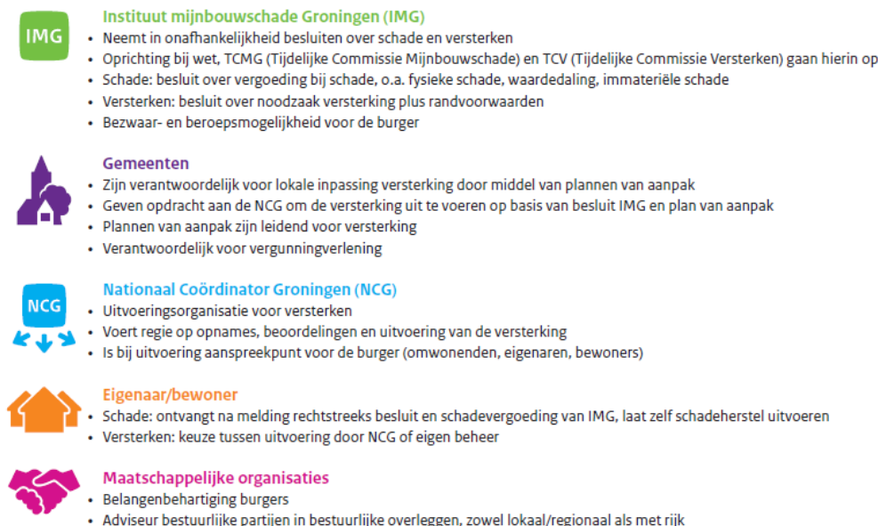
Figuur 2 – Het eindbeeld schade en versterken dat ontstaat na o.a. de wettelijke verankeringen van de nu per besluit vastgestelde werkwijze.