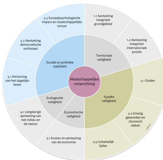
Figuur 1. Termen voor fysieke en sociaalpsychologische aspecten van maatschappelijke ontwrichting volgens de methodiek van de Nationale Risicobeoordeling.