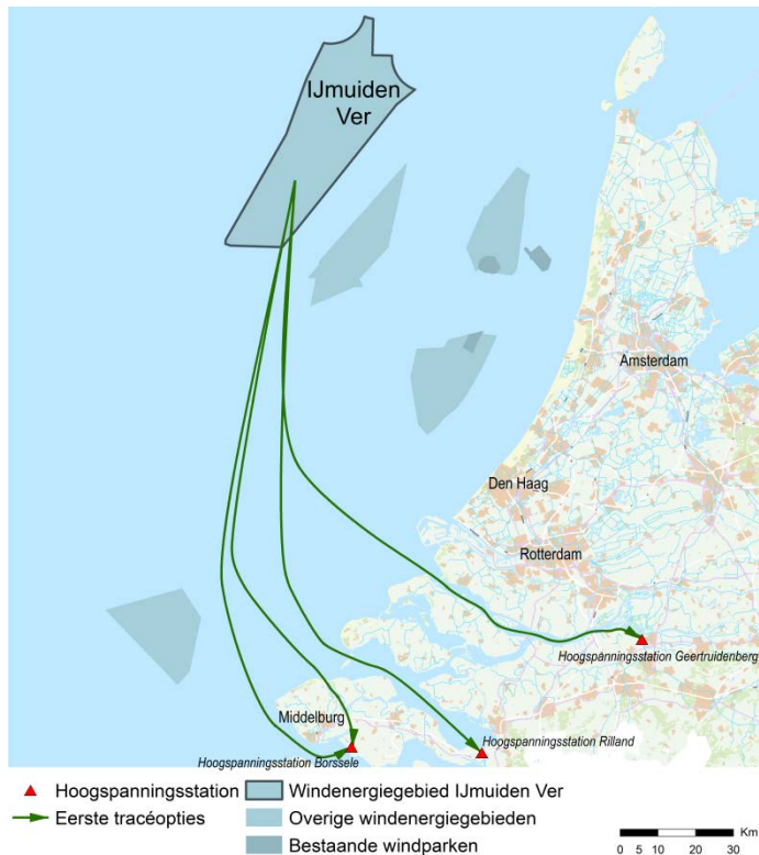
Figuur 2 Tracéopties IJmuiden Ver Alpha o.b.v. de verkenning uit 2018

achtergrondinformatie over deze tracés is te vinden in de stukken over de verkenning via de eerder genoemde website van Bureau Energieprojecten.