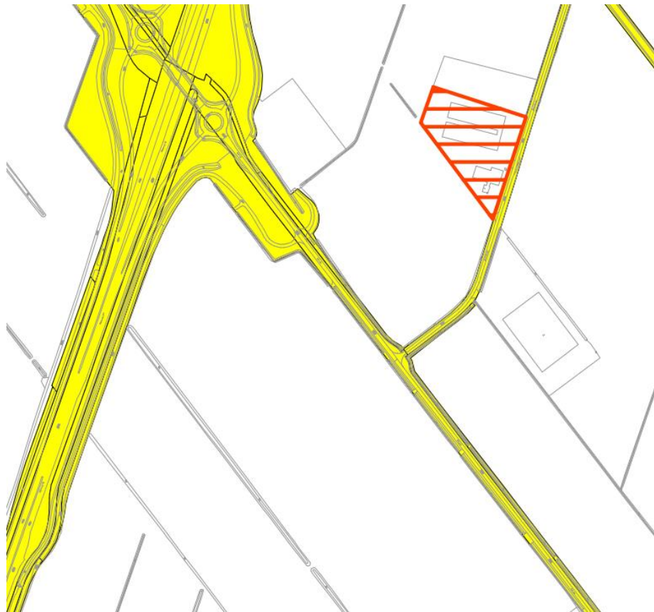
Figuur 5 Uitsnede Groene kaart

Voor het kappen van de bomen dient een omgevingsvergunning te worden aangevraagd op grond van 2.2, lid 1, onder g van de Wet algemene bepalingen omgevingsrecht (Wabo). De betreffende bomen zijn conform de Groene kaart van de Gemeente Veendam onderdeel van de 'houtopstand' (geel in onderstand figuur 5) van de gemeente en andere overheden. Hierdoor moet er voor het kappen van deze bomen een ontheffing (kapvergunning) worden aangevraagd bij de gemeente.