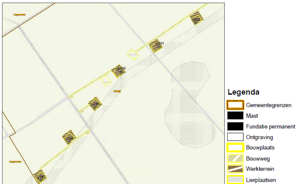
Uitsnede Project "Noord- West 380 kV Eemshaven Oudeschip-Vierverlaten".

Omdat ervoor gekozen is om de grenzen van het inpassingsplan zo dicht mogelijk langs de grenzen van de zakelijk rechtsstrook te laten lopen, vallen op meerdere locaties (delen van) tijdelijke werkterreinen, bouwwegen en inritten buiten de grenzen van het inpassingsplan. Deze (delen van) tijdelijke werkterreinen, bouwwegen en inritten zijn in strijd met het bestemmingsplan "Buitengebied- Noord" en de daarbij gegeven bestemmingen.