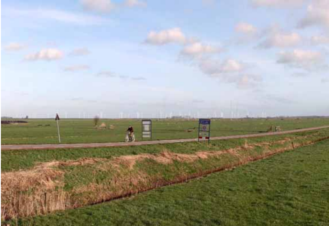
Figuur 4 Zicht windturbines Zuidlob vanaf Meentweg in Eemnes