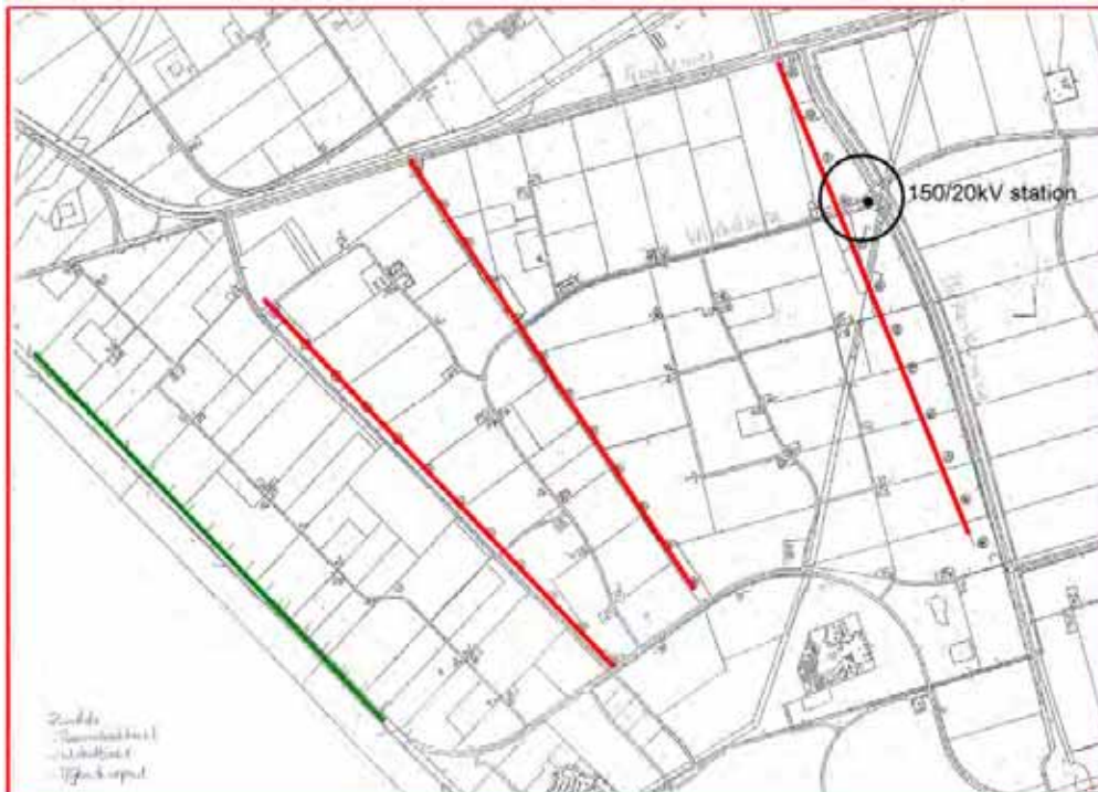
Figuur 1 Drie lijnopstellingen (rood) en het onderstation (150/20kVstation). De groene lijn is de bestaande windturbineopstelling nabij de Eemmeerdijk

De keuze voor de locatie van het windturbinepark in de Zuidlob is deels ingegeven door de geschiedenis van het initiatief en deels door de locatiekenmerken van de Zuidlob. Het initiatief is medio 2004 opgepakt. Er was toen sprake van opschaling van een lokaal initiatief binnen de gemeente Zeewolde. Het oorspronkelijke plan als geheel voldeed aan het toen geldende gemeentelijke en provinciaal beleid. De provincie heeft van het initiatief een pilotproject gemaakt. Vanuit de gedachte 'minder molens, meer energie' hebben de initiatiefnemers het huidige plan samen met gemeente en provincie ontworpen. Daarmee is bereikt dat alle bewoners van de Zuidlob mee kunnen doen in het windpark en dat de bestaande kleine windturbines gesaneerd kunnen worden. Er worden hierdoor niet alleen meer MW's geplaatst, maar door de gunstige lijnopstelling zal de energieopbrengst per MW ook groter zijn. Overigens moet worden opgemerkt dat niet alle bewoners van het gebied participeren in het project. De lijnopstelling zoals deze nu in het inpassingsplan mogelijk wordt gemaakt is zorgvuldig gekozen. Oorspronkelijk zijn 14 alternatieve opstellingen binnen de Zuidlob onderzocht. Deze alternatieve opstellingen zijn eveneens in het planMER (2009) opgenomen. Op basis van milieueffecten, openheid, realiseerbaarheid, rendement en de gevoeligheid van het gebied is gekozen voor de huidige lijnopstellingen. Verwezen wordt naar figuur 1.