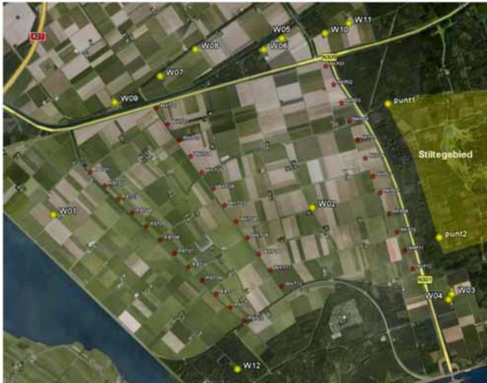
Figuur 5 Aanduiding windturbines (rode sterren), relevante woningen van derden (gele stippen W0x) en het stiltegebied