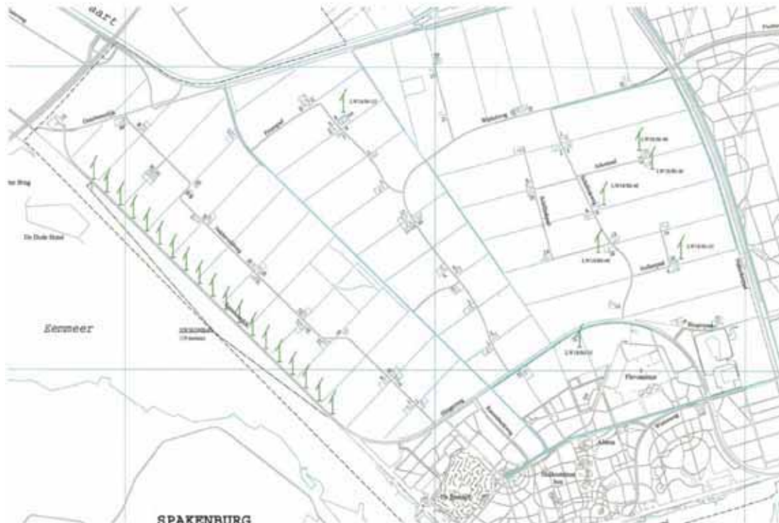
Figuur 2 Bestaande windturbines in het plangebied