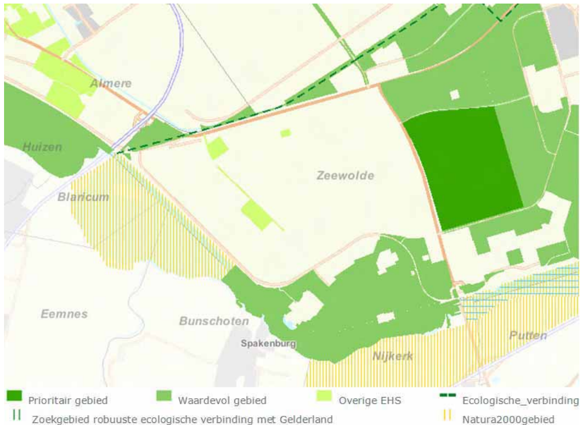
Figuur 3 EHS gebieden