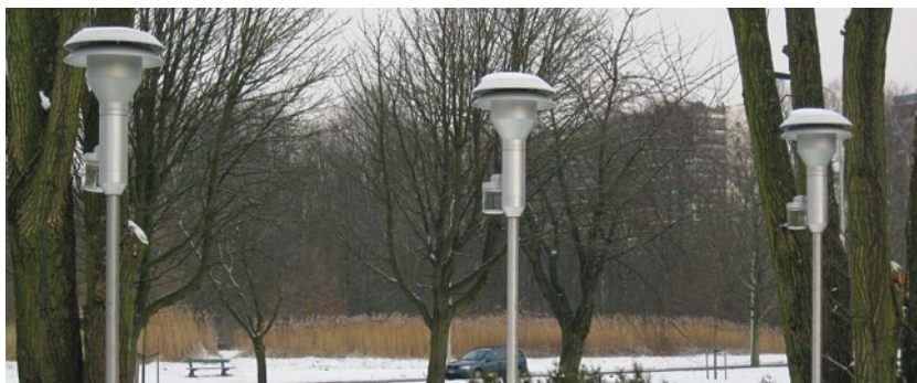
Het project Joaquin meet luchtkwaliteit met nieuwe apparatuur

De slagingskans van het afgelopen Interreg-programma lag rond de 30 procent voor NWE en 50 procent voor NSR. Dit percentage kan met vaak simpele tips en trucs flink stijgen; één of enkele gesprekken met onze contactpersonen en/of meer ervaren deelnemers kunnen hierbij helpen.