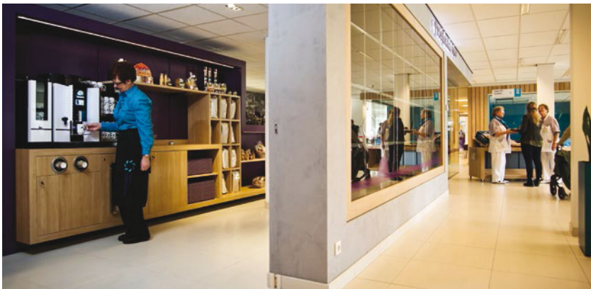
Project Pure Hubs zorgt voor een nieuw proeflokaal in het Máxima Medisch Centrum in Eindhoven.

De 'Staalkaarten' van de programma's geven een overzicht van alle tot nu toe goedgekeurde projecten in het subsidieprogramma, met een korte beschrijving, plus een vermelding van alle Nederlandse partners en hun contactgegevens. Zie hiervoor www.agentschapnl.nl .