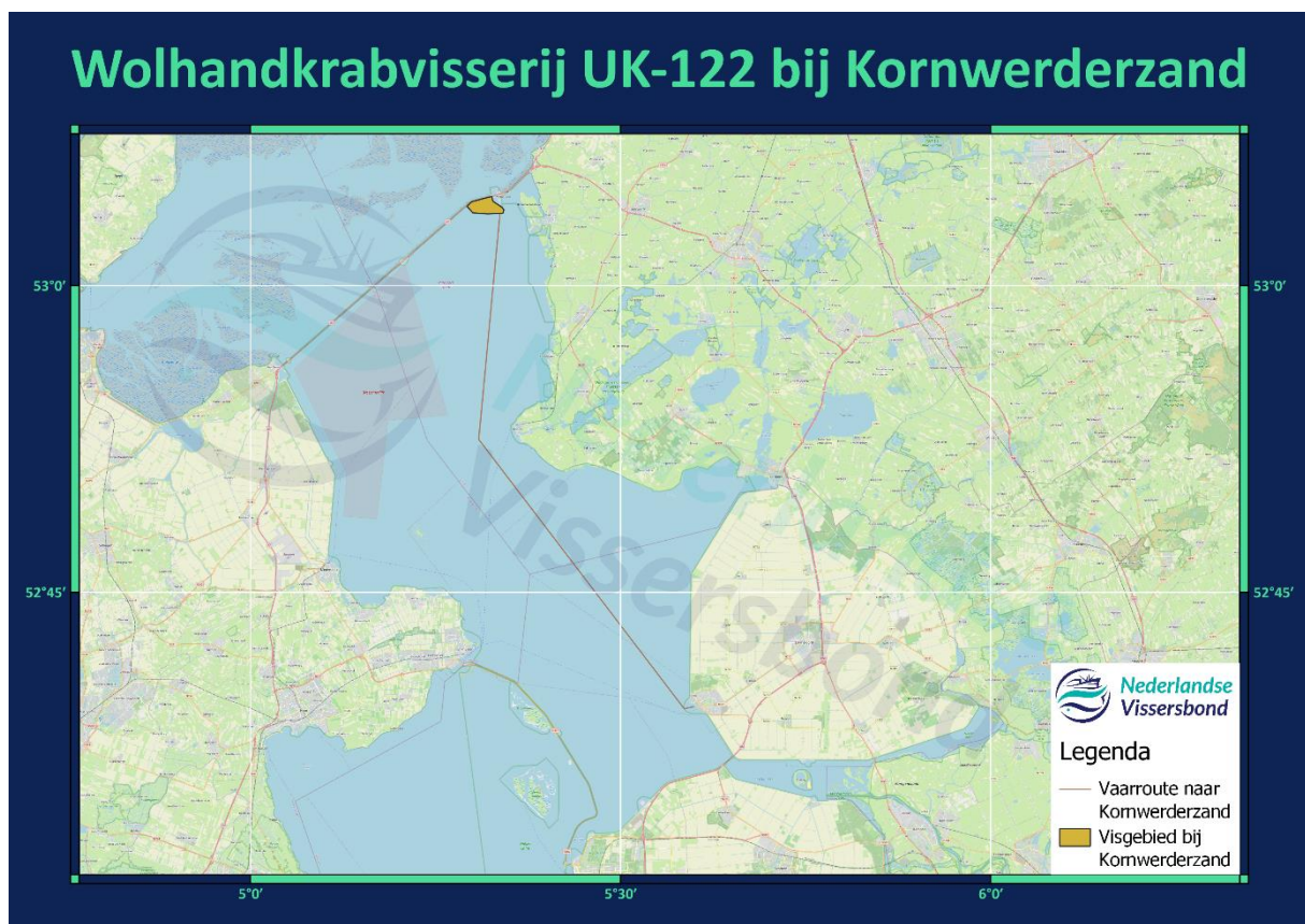
Figuur 1: De vaarroute en het visgebied voor de UK-122.

Figuur 1 weergeeft zowel het visgebied bij Kornwerderzand als de vaarroute die die UK-122 aflegt vanaf de haven van Urk naar het visgebied.