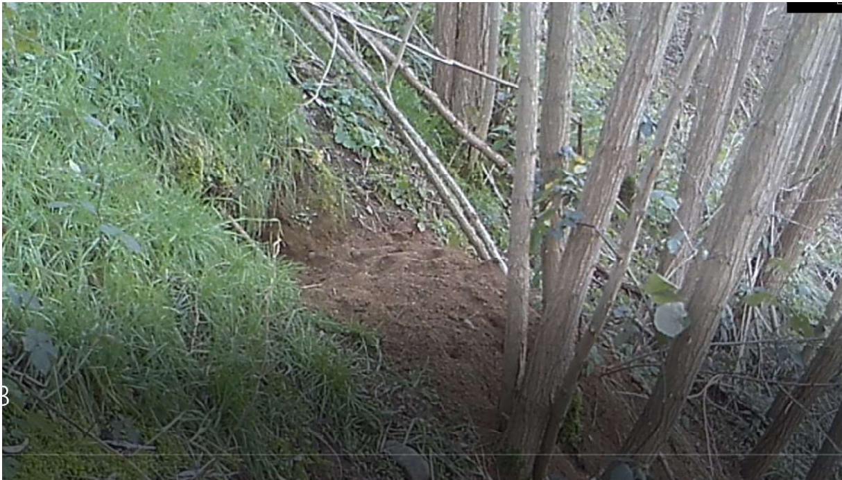
Figuur B : dassenburcht 15

In 2022 is de betreffende burcht 15 tijdens onderzoek ontdekt. Vanaf 23-12-2022 tot 01-02-2023 heeft RWS met cameratoezicht vastgesteld, dat er tenminste één das gebruik maakte van de burcht zie figuur hieronder.