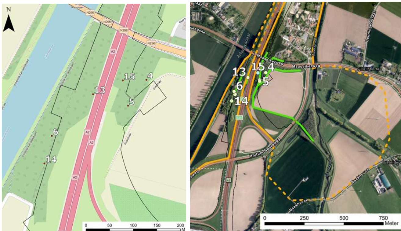
Figuur 5-2: Genummerde locaties van de burchten ten zuidoosten en zuidwesten van de brug naar Roosteren.