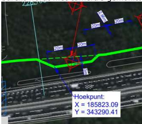
Figuur D: raster rond burcht 15

De passieve verplaatsings werkwijze van burcht 13 wordt ook bij burcht 15 gebruikt. Ook deze burcht wordt met camera's gemonitord op gebruik van de burcht.