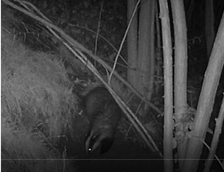
Figuur C : das bij burcht 15 op 13 januari 2023.

De passieve verplaatsings werkwijze van burcht 13 wordt ook bij burcht 15 gebruikt. Ook deze burcht wordt met camera's gemonitord op gebruik van de burcht.