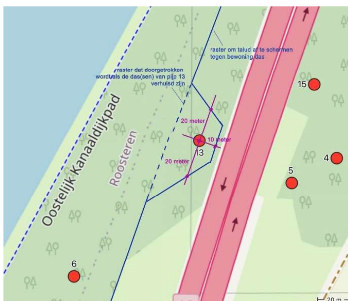
Figuur 3-3: Schets rasterprincipe rond burcht 13.

Op deze locatie zijn eveneens drie burchten aanwezig, ook op een grondwal van een oude oprit naar de A2. Twee burchten met resp. één en twee pijpen liggen op enige afstand van de A2, en één burcht met één pijp vlak erlangs. Deze laatste burcht ligt op een helling die uiteindelijk op de schop genomen zal worden. Ter voorkoming dat er nog meer burchten op de helling gegraven worden die uiteindelijk niet kunnen blijven wordt een tijdelijk raster bovenaan de helling gezet (figuur 3-2 en 3-3). Om de das van burcht 13 (die in deze helling zit) de gelegenheid te geven vrijwillig te verhuizen zal eerst het tijdelijk raster rondom deze burcht geplaatst worden. Het raster bovenaan de helling zal na vrijwillige verplaatsing van de das gedicht worden. In bijlage 4 wordt de werkwijze uitgebreid beschreven.