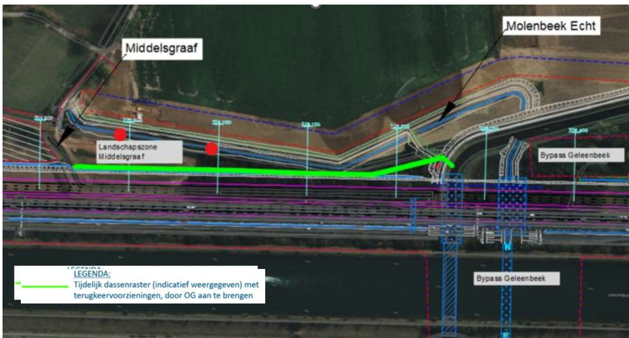
Figuur 3-1: locatie tijdelijk raster (groene doorgetrokken lijn). De rode punten zijn burchten.

Op deze locatie zijn twee burchten van dassen aanwezig in de droge bedding van de Molenbeek te Echt. Eén burcht met één pijp, en één burcht met twee pijpen. Ter voorkoming dat de dassenburchten graven in het gebied waar de A2 verbreed zal worden, zal een tijdelijk raster op de grens van de toekomstige weg gezet worden. In figuur 3-1 is de locatie van het tijdelijke raster weergegeven.